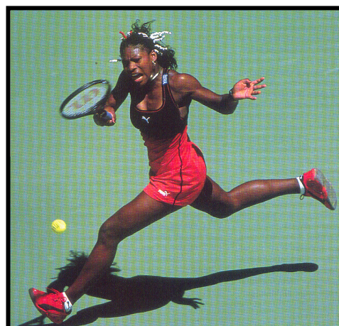
A vestimenta da tenista contemporânea proporciona mais liberdade de movimentos e conforto.