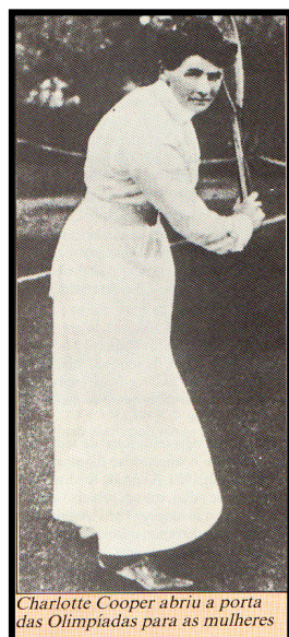
Figura 1: Charlotte Cooper primeira medalha de ouro em tênis (1900) Jogos Olímpicos em Paris com vestimenta usada pelas tenistas da época.